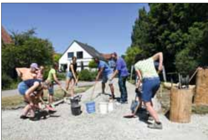
Gemeinsam wird gearbeitet