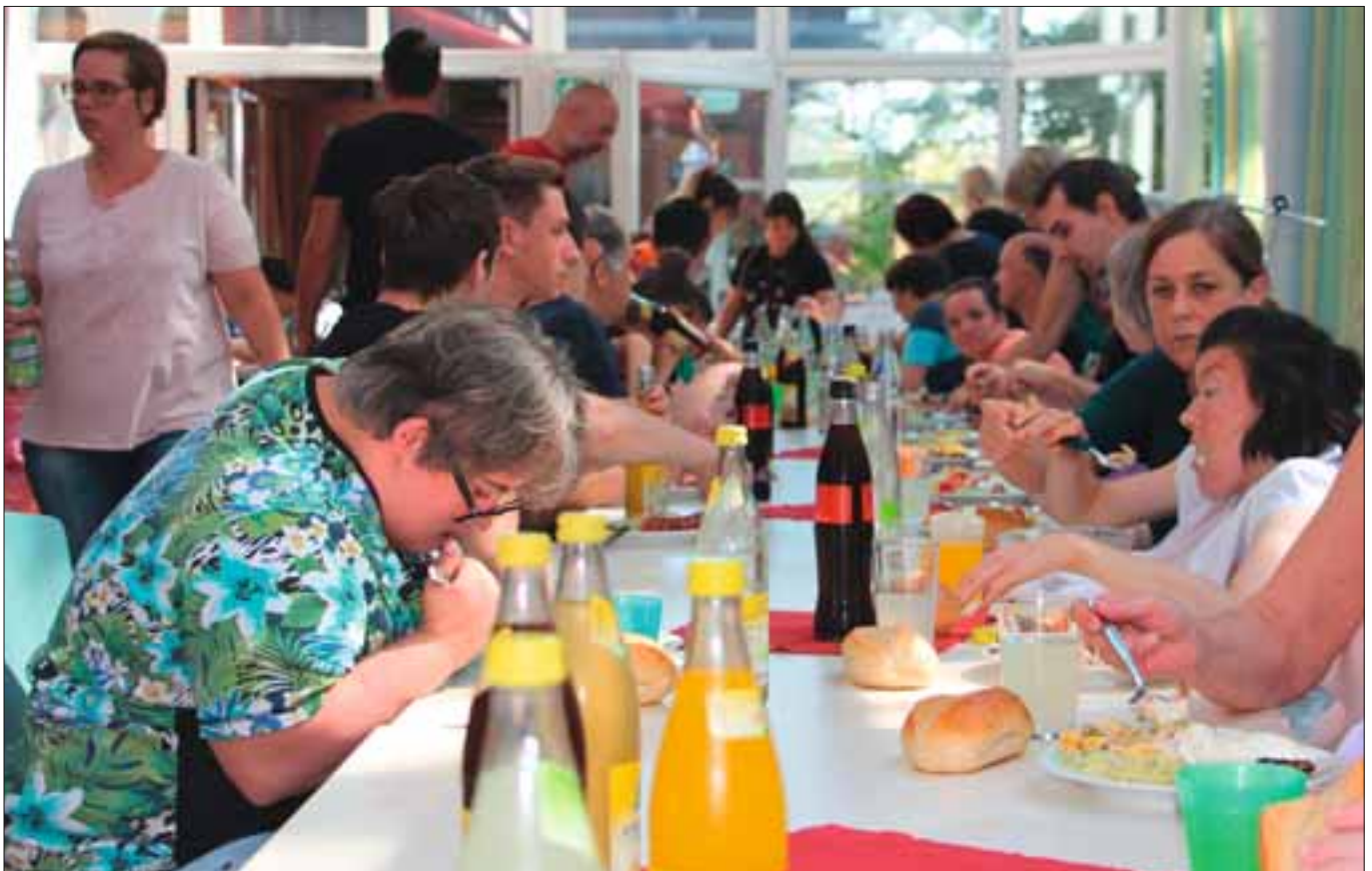
Wir lassen es uns schmecken

Dann gab es leckeres Essen vom Grill. Jetzt waren auch die Internen Kunden vom FuB dabei. Natürlich gab es nach dem Essen auch Musik und Tanz. Alle hatten viel Spaß. Der FuB-Beirat Sindelfingen bedankt sich bei allen, die beim Organisieren dem Vorbereiten vom Essen geholfen haben.