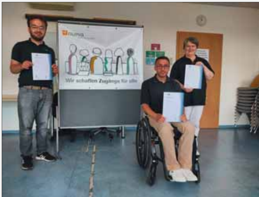
Wir sind stolz auf das Erreichte

Zwei neue-Evaluatoren und eine Evaluatorin schlossen ihre Berufsausbildung als Fachpraktiker/-in für Bürokommunikation erfolgreich ab. Zwei erhielten damit auch ihren Hauptschulabschluss. Hier berichten sie von der nicht immer ganz einfachen Zeit: