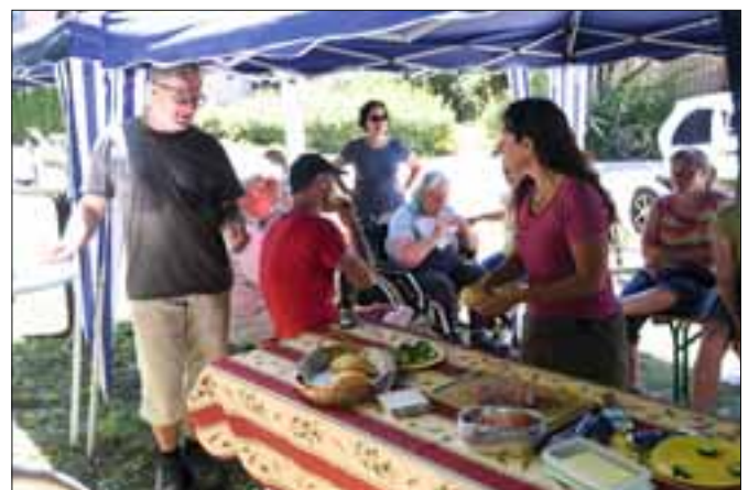
und die Fertigstellung gefeiert