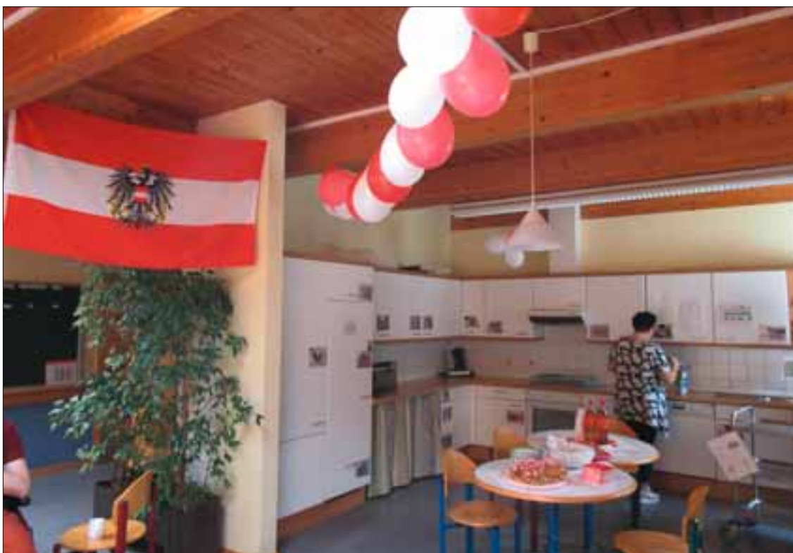
Alles erstrahlt in Rotweissrot

Was für Bräuche es in Österreich gibt. Manche trugen Kleidung aus Österreich. Später gab es Musik und es wurde getanzt. Zum Essen gab es Apfelstrudel und Neapolitaner Kekse. Zum Trinken gab es Almdudler. Es hat allen sehr gefallen. Deshalb will man nochmal einen Themen-Tag machen. Mal sehen, um was es dann geht.