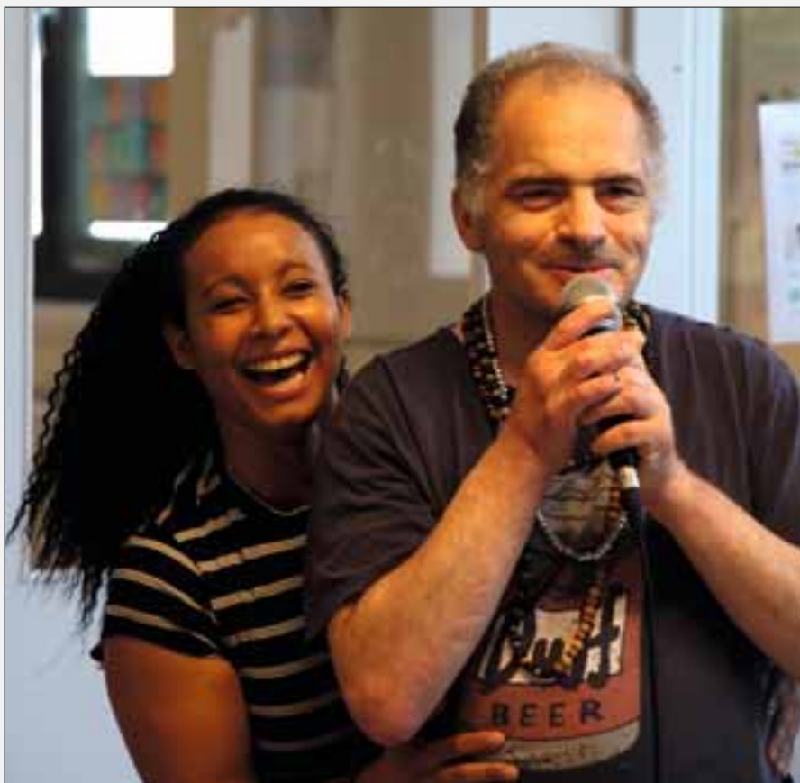
Karaoke macht Spaß

Der Beirat des Förder- und Betreuungsbereichs (FuB) in Sindelfingen plante das diesjährige Sommerfest zu Ehren des gesamten GWW-Beiratsgremiums. Das Sommerfest fand am 25. August 2022 in den Räumlichkeiten des Sindelfinger FuBs statt. Die Festlichkeit begann um 10 Uhr mit einer Führung durch den Sindelfinger FuB für die Beiräte. Hier zeigte jede Gruppe, was diese über die Woche verteilt den Internen Kunden anbietet und welche Produkte sie gemeinsam herstellen.