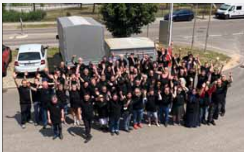
Die Mitarbeiter bejubeln das Jubiläum

Allen Mitwirkenden nochmals herzlichen Dank! Auf die nächsten 10 Jahre!