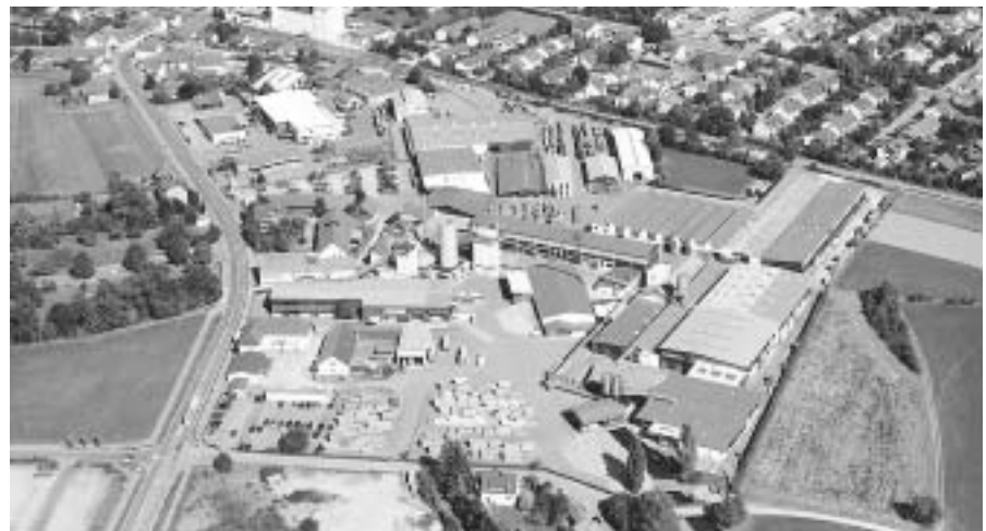
Links: Stehtische der Firma RUKU. Unten: Das RUKU-Werk in Illertissen.

Die zugekauften Holzplatten werden zukünftig selbst gefertigt