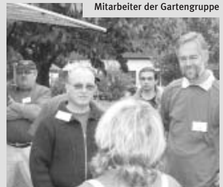
Mitarbeiter der Gartengruppe