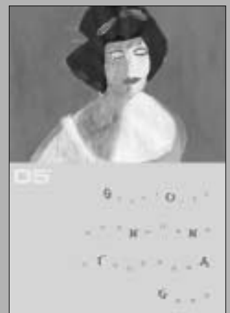
Motive aus dem aktuellen Kalender