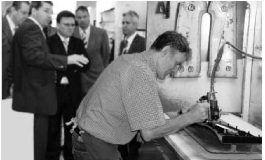
Klebstoffauftrag beim Türmittelfeld (DaimlerChrysler)

Eine grundsätzliche Veränderung erfuhr der Standort Herrenberg durch die Entscheidung, die dortige Halle ausschließlich für die Gesteckfertigung der F e s t z e l t -