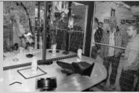
Roboter auf dem GWW-Messestand im Einsatz