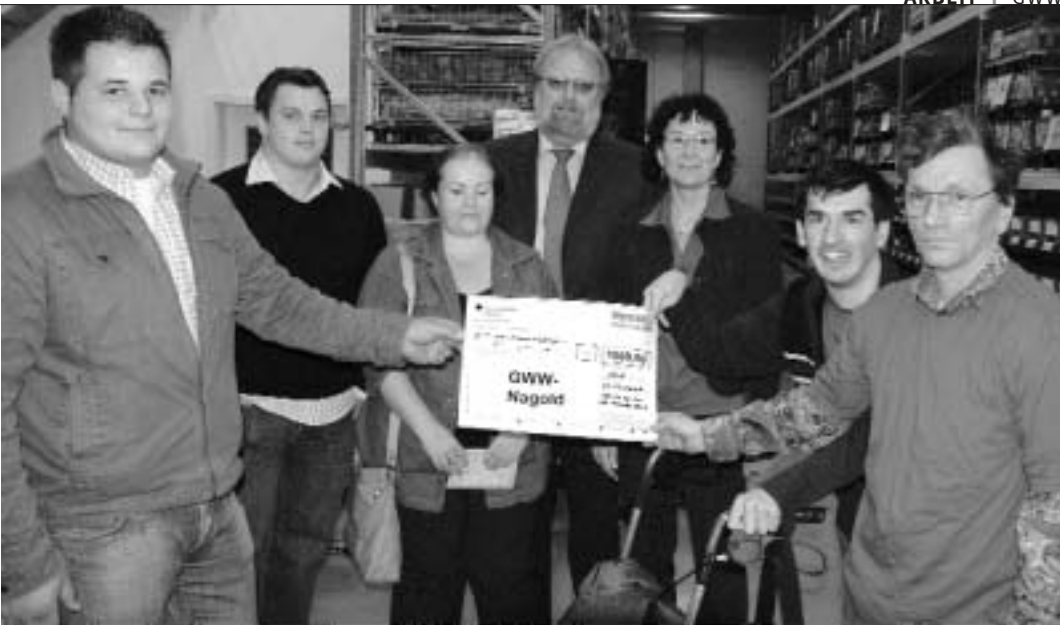
Die Mitarbeiter von Bosch-Rexroth übergaben einen Scheck an die GWW.