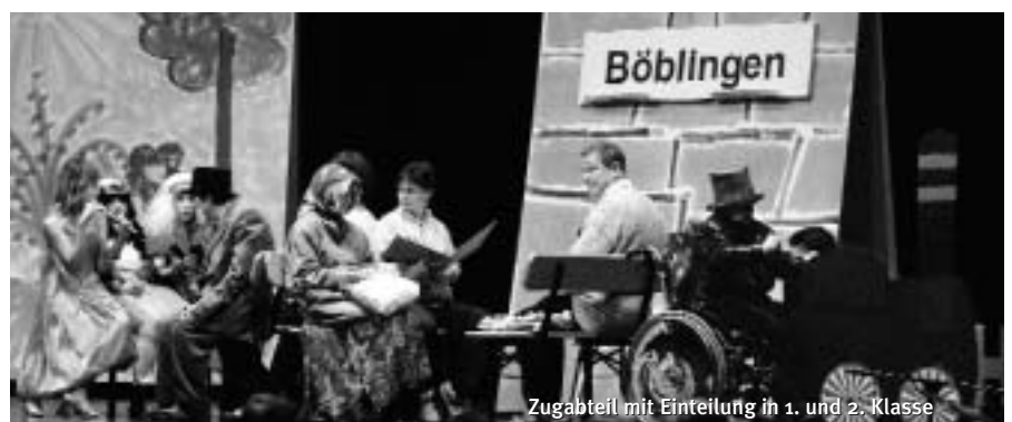
Zugabteil mit Einteilung in 1. und 2. Klasse

Herbert Beilschmidt | Öffentlichkeitsarbeit