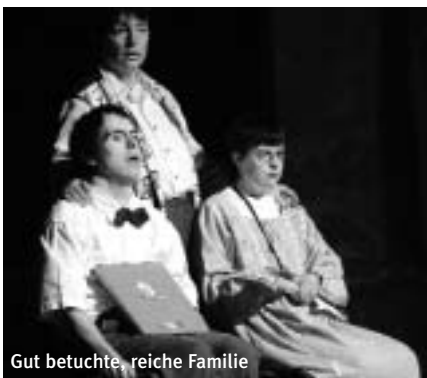
Gut betuchte, reiche Familie

Schon vor eineinhalb Jahren wurde der "Zug der Geschichten" in Nagold unter Dampf gesetzt, denn damals setzten sich die Verantwortlichen zusammen und überlegten, was nach "Hans im Glück" und "Don Quichotte" folgen könnte. Nach diesen beiden Aufführungen wagte man sich an ein eigenes Stück – eine Szenencollage rund um das Thema Integration. Zu einem »Zug der Geschichten« bündelten sie die kurzen Anspiele.