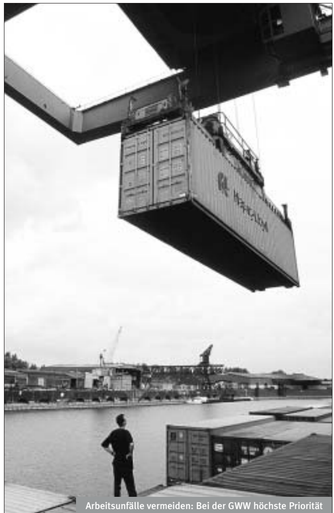
Arbeitsunfälle vermeiden: Bei der GWW höchste Priorität