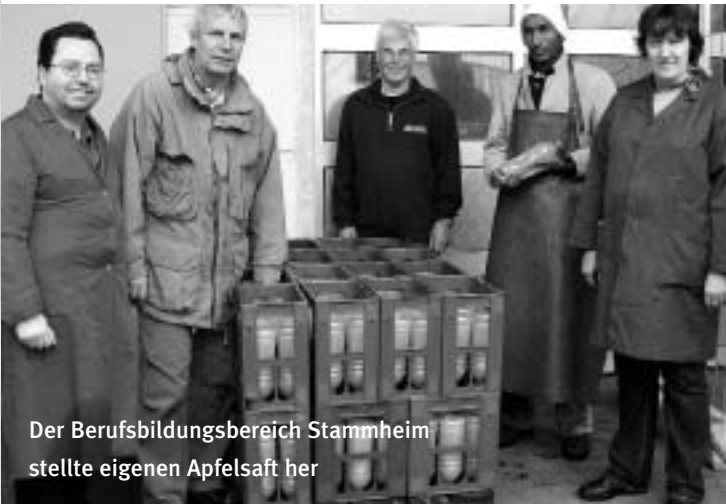
Der Berufsbildungsbereich Stammheim stellte eigenen Apfelsaft her

Da es im vergangenen Herbst sehr viele Äpfel gab, bot es sich an, Apfelsaft für den Eigenbedarf herzustellen. Freundlicherweise überließ uns ein Hobbylandwirt seine Streuobstwiese, wovon wir sechs Zentner Äpfel einsammeln konnten. Mit der Gärtringer Mosterei "Saftladen" wurde ein kompetenter Geschäftspartner in Sachen Apfelerwertung gefunden. Mit vier Teilnehmern stellten wir uns der Aufgabe des Safterstellens.