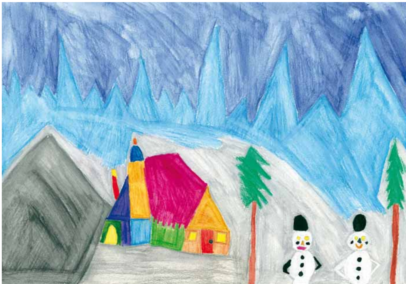
„ SCHNEEMÄNNER “ (Mischtechnik) Winterbild von Sabine Zink