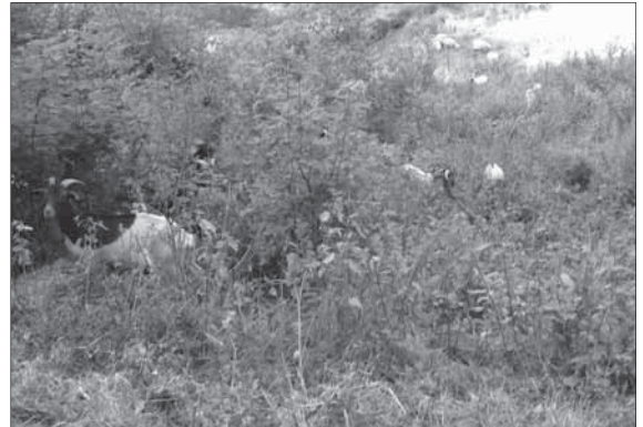
Im Gütersbachtal vor der Veränderung: Ziegen beim mühsamen Weiden