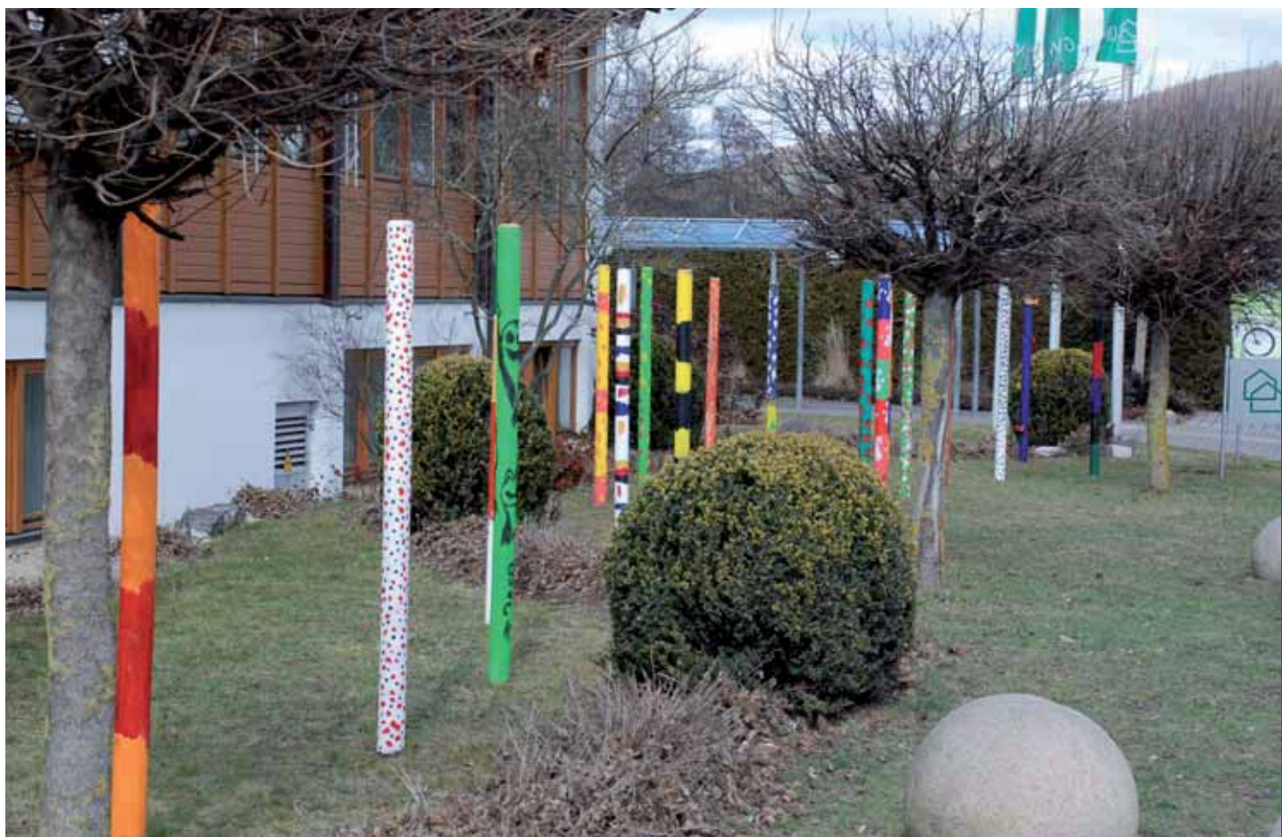
Kunstleitpfosten zur Landesgartenschau vor dem GWW-Werk Nagold