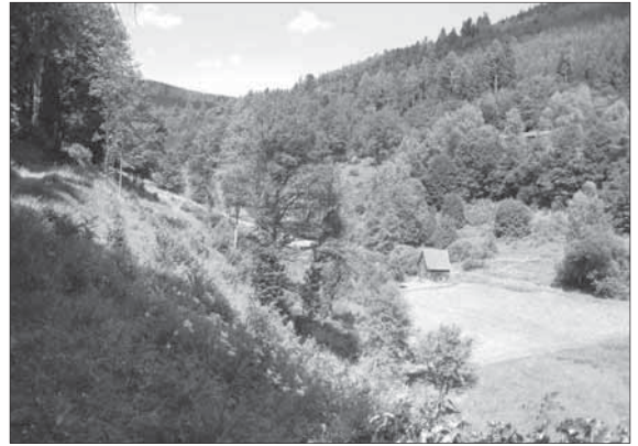
Im Gütersbachtal vor der Ausgleichsmaßnahme

Jede Gemeinde hat ein sogenanntes Ökopunktkonto; dieses wird so ähnlich wie ein Girokonto verwaltet: Wenn Ökopunkte verlorengehen, müssen wieder Ökopunkte geschaffen werden (Ausgleichsmaßnahmen). Ins Minus kann man nicht