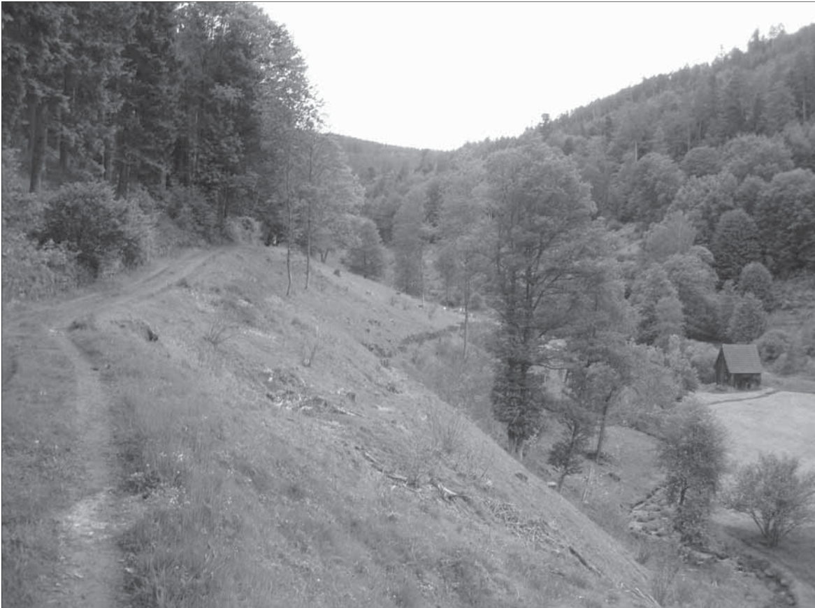
Im Gütersbachtal nach der Ausgleichsmaßnahme 1 Jahr später: Die Natur hat die Wunden des Eingriffs wieder geheilt