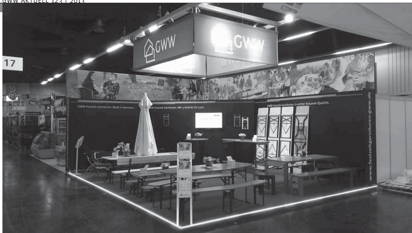
Das Bild zeigt den GWW-Messestand im neuen Design und mit innovativen Produkten