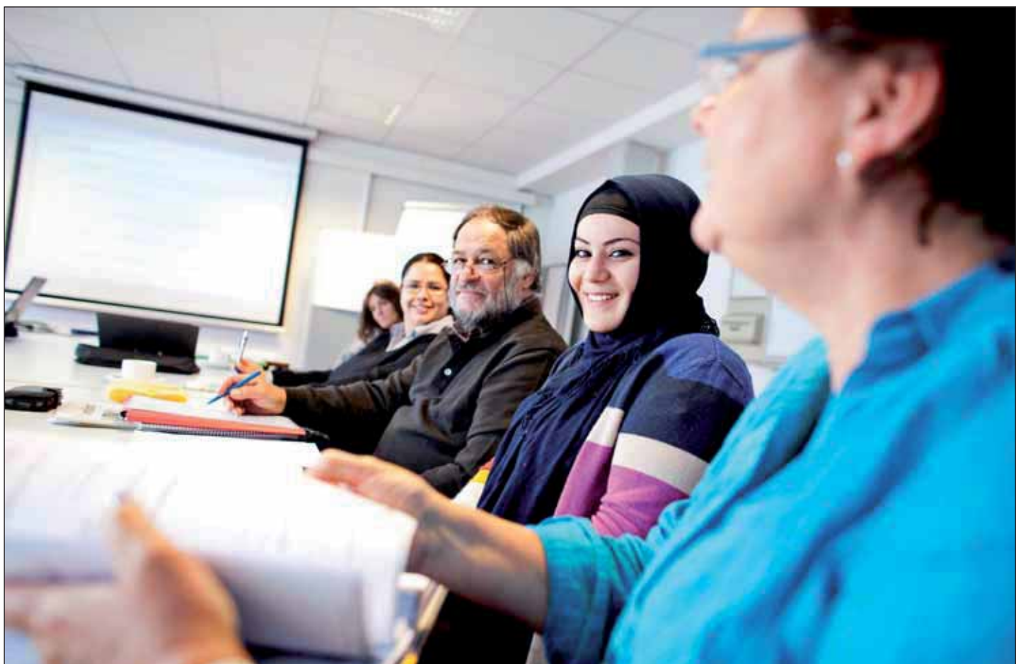
Treffen der Kulturvermittler