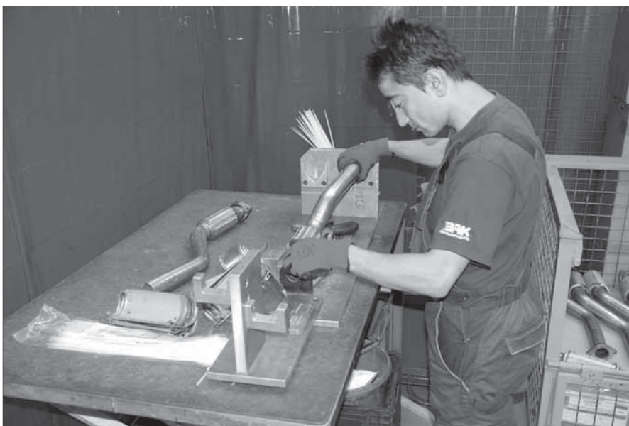
Außenarbeitsplatz bei BAK in Simmersfeld